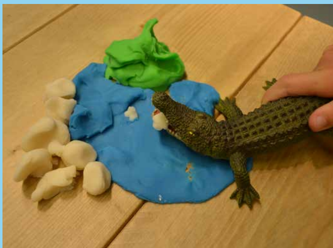
♥ Toevoegen van spelmateriaal