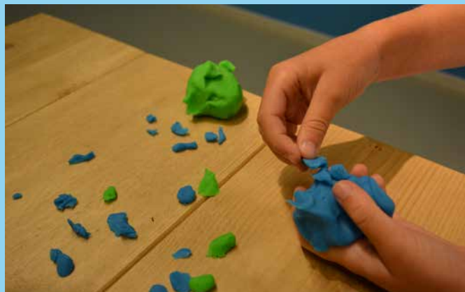
♥ Stap 1 - Xxxxxxxx xxxxxx xxxxxxxx