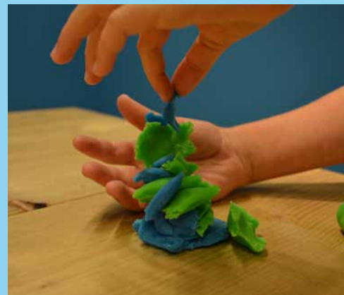
♥ Stap 2 - Xxxxxxxx xxxxxx xxxxx