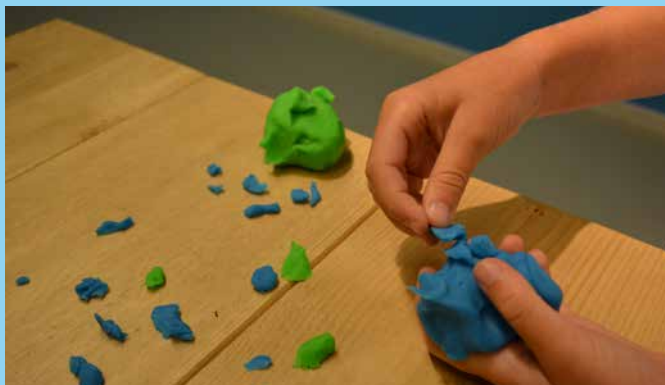
♥ Kleine brokjes van groot geheel en terugplakken