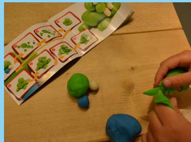
♥ Iets namaken