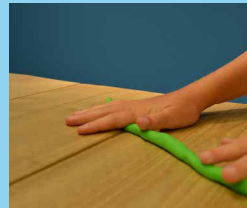
♥ Stap 3 - Xxxxxxxx xxxxxx xxxxx