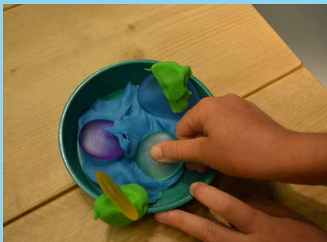
♥ Toevoegen looseparts