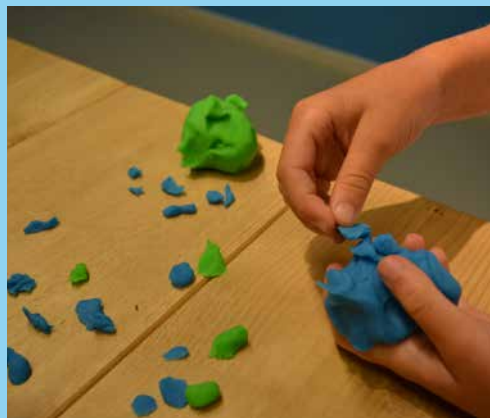
♥ Stap 1 - Xxxxxxxx xxxxxx xxxxx