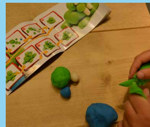
♥ Stap 6 - Xxxxxxxx xxxxxx xxxxx