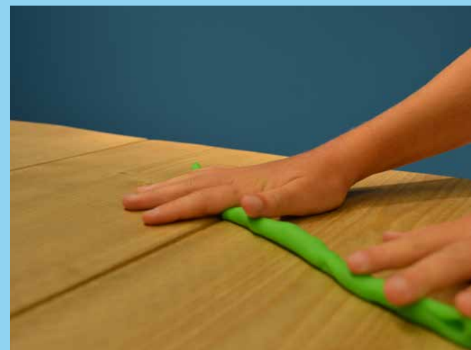
♥ Slang rollen