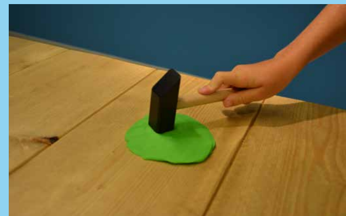
♥ Plat slaan/Plat drukken