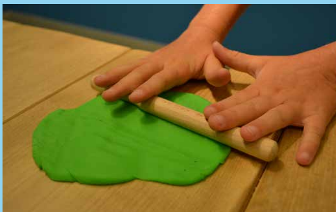
♥ Rollen met materiaal