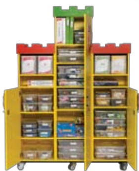
De Pittige Plus Torens, inclusief teamcursus, het meubel en alle lesmaterialen.